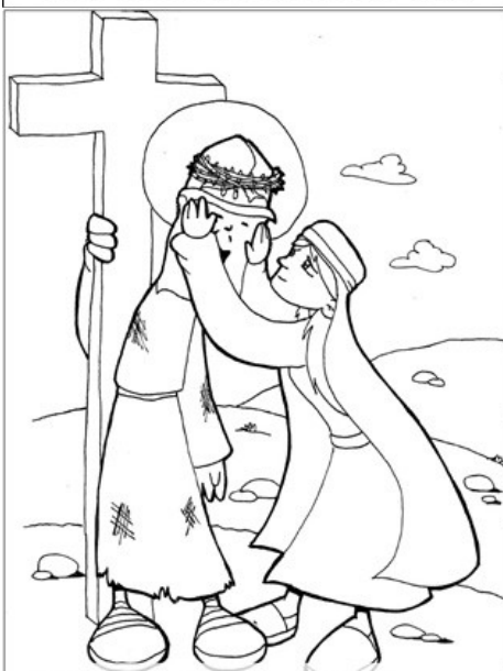
6º ESTACIÓN: LA VERÓNICA ENJUGA EL ROSTRO DE JESÚS