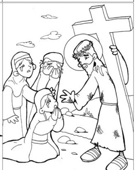
8º ESTACIÓN: JESÚS CONSUELA A LAS MUJERES DE JERUSALÉN