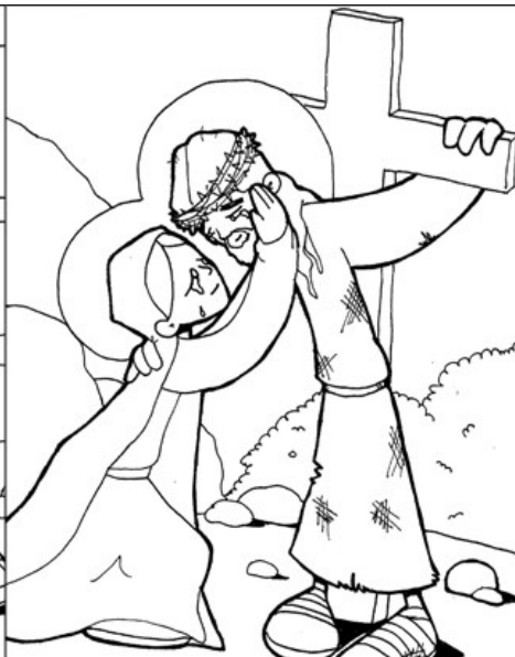
4º ESTACIÓN: JESÚS SE ENCUENTRA CON SU MADRE