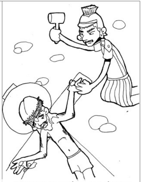
11° ESTACIÓN: JESÚS ES CLAVADO EN LA CRUZ