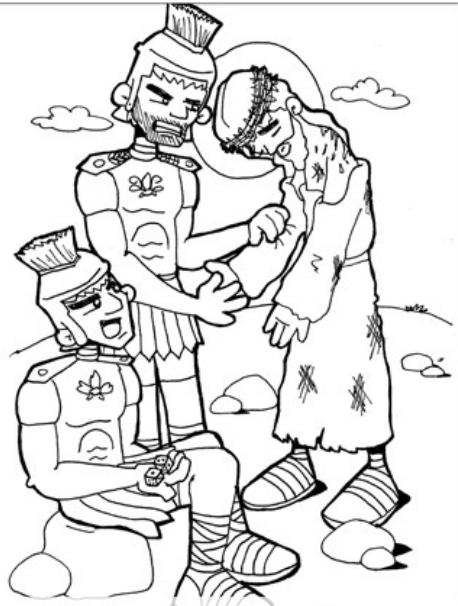
10° ESTACIÓN: JESÚS ES DESPOJADO DE SU ROPA