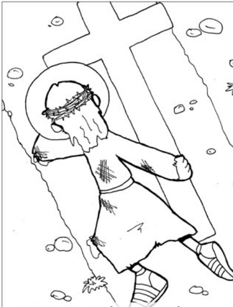
9° ESTACIÓN: JESÚS CAE POR TERCERA VEZ