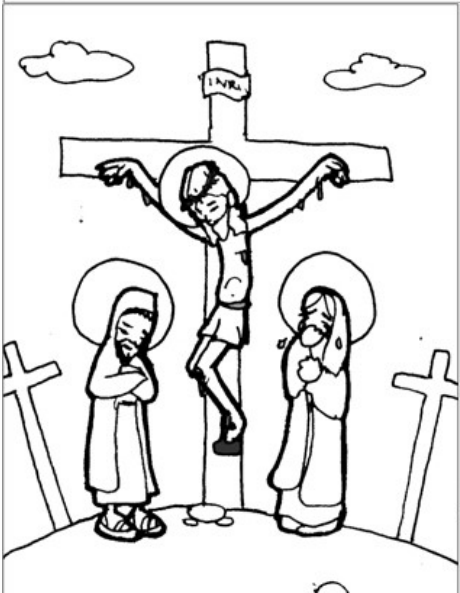
12° ESTACIÓN: JESÚS MUERE EN LA CRUZ