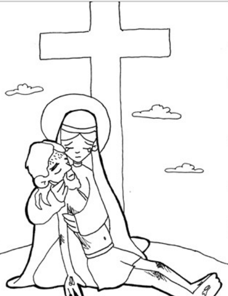
13° ESTACIÓN: JESÚS ES BAJADO DE LA CRUZ