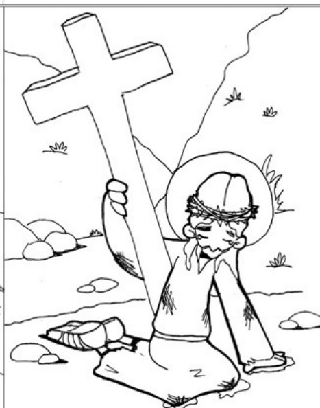
7º ESTACIÓN: JESÚS CAE POR SEGUNDA VEZ