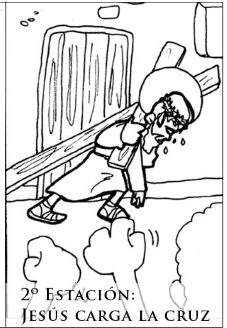
2º ESTACIÓN: JESÚS CARGA LA CRUZ