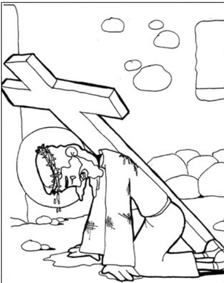
3º ESTACIÓN: JESÚS CAE POR PRIMERA VEZ