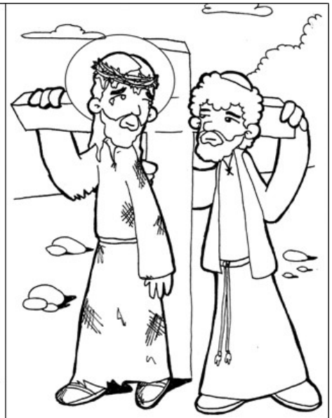
5º ESTACIÓN: EL CIRENEO AYUDA A JESÚS A CARGAR LA CRUZ