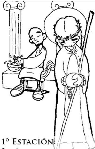
1º ESTACIÓN: JESÚS ES CONDENADO